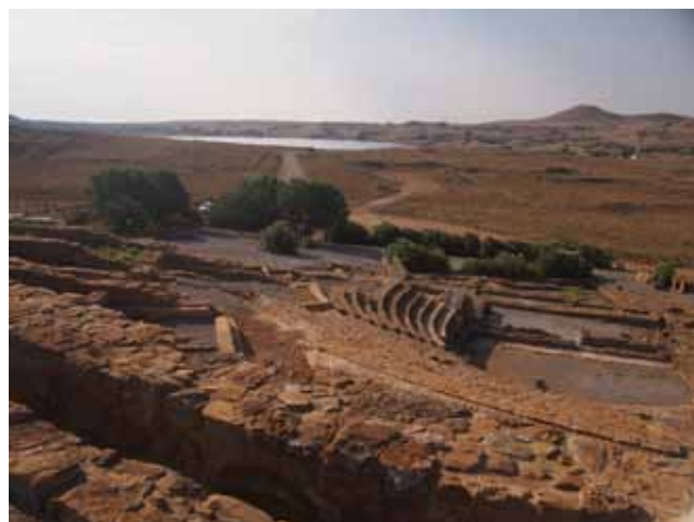
Zrekonstruované antické divadlo Ifestia, ale chybí k němu vhodná přístupová cesta