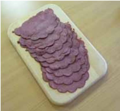
Hovězí šunka z Rudolce