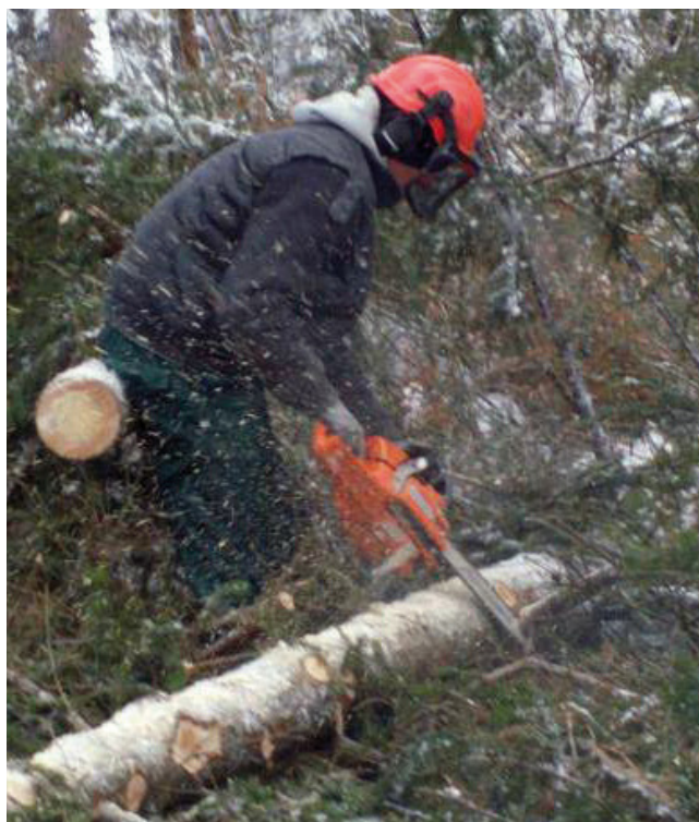
Srdce a čin, o.p.s. - Práce s motorovou pilou

Farma Hory se nachází v blízkosti mezi městy Locket a Karlovy Vary v malebné přírodě. Součástí Farma Hory jsou zařízení pro ustájení a výcvik koní a penzion s restaurací. Prostředí je vhodné pro milovníky koní a vycházek do přírody. Farma je ideálním prostředím pro konání společenských akcí, svateb, rodinných oslav. Další podrobnější informace lze získat na www.farma-hory.cz .