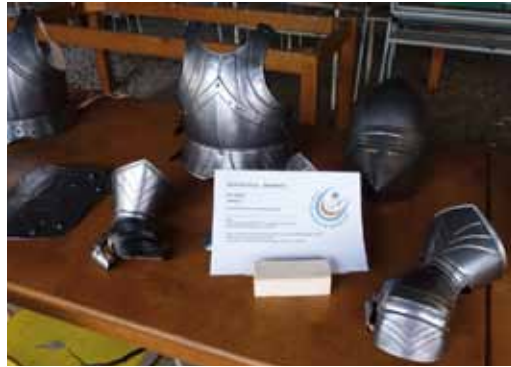
Rytířská zbroj – platiněství