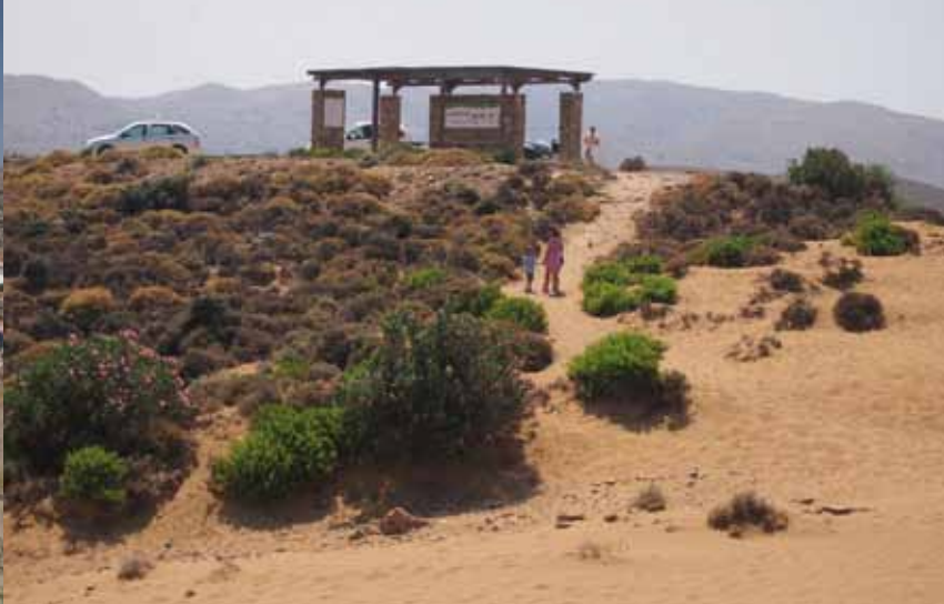
Vyhledka s informačními tabulemi u přírodní zajímavosti písečné duny

nější archeologické památky Limnosu pocházejí ze stejné doby jako památná Trója, jenom Limnos není tolik známý, neměl to štěstí a nebyl objeven a zpopularizován Heinrichem Schliemannem nebo Arturem Evansem jako řecké Mykény a Knóssos. Novodobé dějiny Limnosu jsou spojeny s řecko – tureckými boji. Na počátku 19. století, kdy během národní osvobozenéckého boje vznikalo opět svobodné Řecko, byl Limnos stále pod tureckou nadvládou. Ostrov byl osvobozen Řeky až v roce 1912.