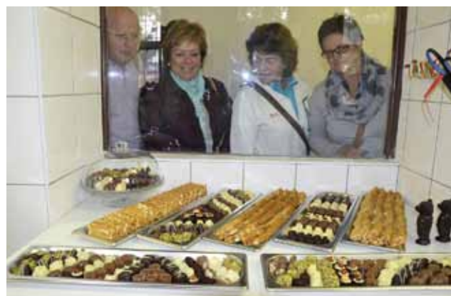
Čokolatier v akci