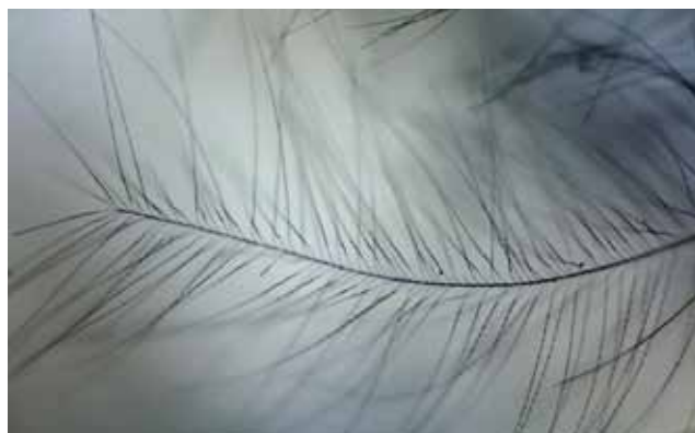
Pírko pod mikroskopem