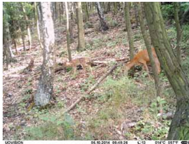
Snímek z fotopasti