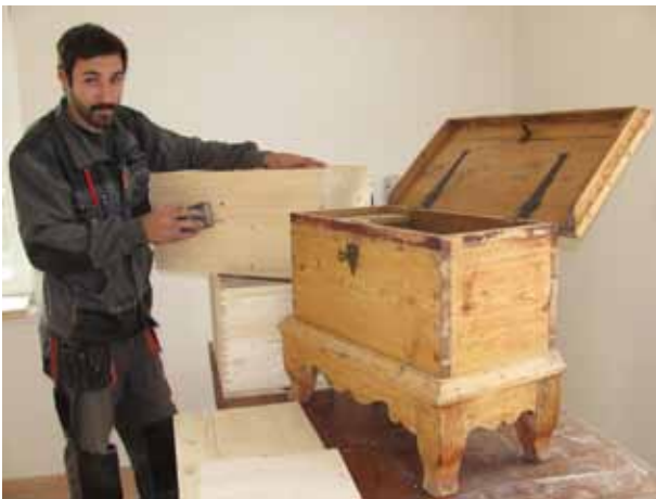
Selská truhla chebského stylu