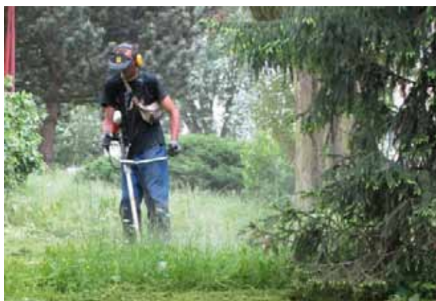
Srdce a čin, o.p.s. - Úprava veřejné zeleně