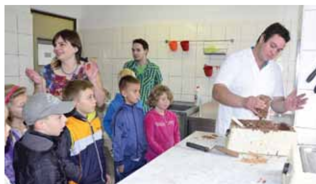
Přehídka čokoládových specialit