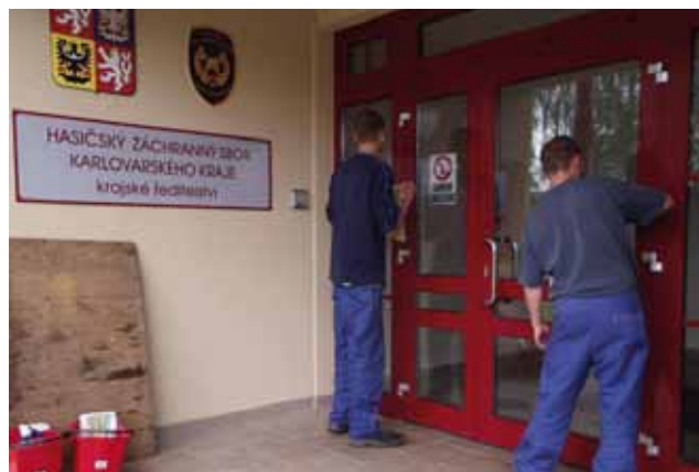
Srdce a čin, o.p.s. - Úklid veřejných budov