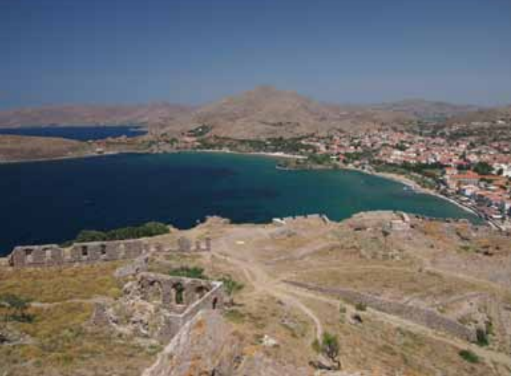
Pohled na Myrinu - hlavní město ostrova Limnos