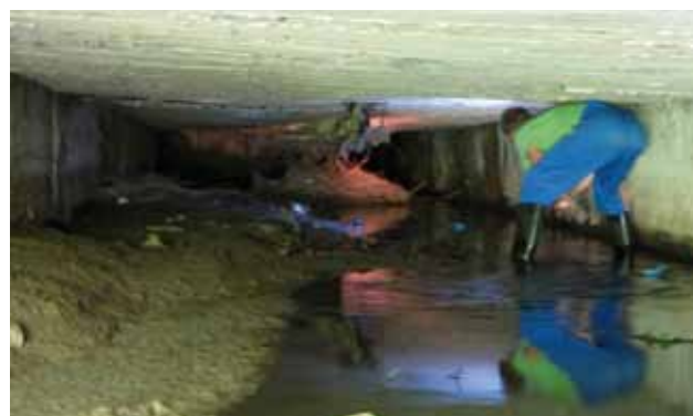
Čištění Břehnického potoka

„Jednou z posledních větších záležitostí bylo čištění koryta Břehnického potoka od nánosů bahna, písku a dalšího materiálu, který voda přinesla. Specifikem bylo, že šlo o úsek v tunelu, kde ode dna ke stropu nebylo více než 120 centimetrů, někde jen 90 čísel. Pracovat jsme museli převážně v broďákách,