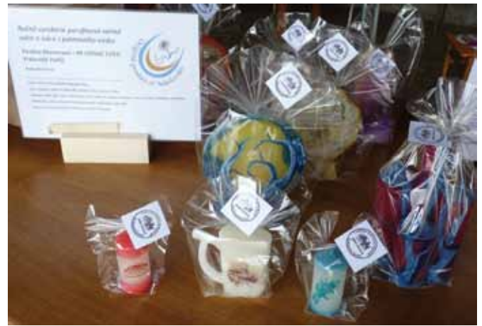
Ručně vyrobené parafínové vonné svíce a svíce z palmového vosku