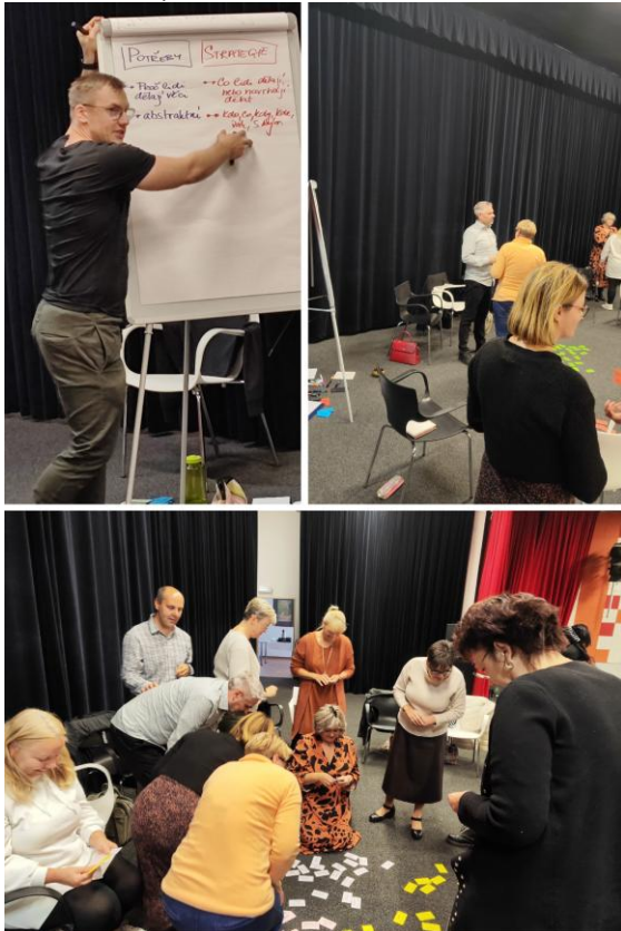
Kritické myšlení, kyberprostor, UI, 14. 5. 2025