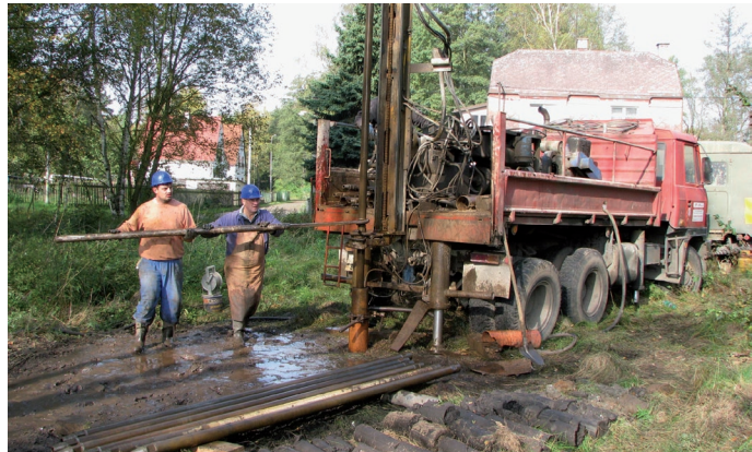
Realizace průzkumného vrtu v Dolním Rychnově

Pro zjištění energetického potenciálu a odhadu kvality důlních vod byl na podzim roku 2010 proveden průzkumný vrt na poddolaném území obce Dolní Rychnov . Výsledky měření se staly podkladem pro vypracování jednak projektových dokumentací vytápění tří veřejných objektů v obci Dolní Rychnov - Mateřská školka, Dům pro seniory a Obecní úřad, jednak projektu geotermální